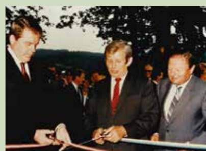
Eröffnung Privatkrankenanstalt für Stoffwechselerkrankungen und Haus Hochwald