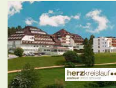
Herz-Kreislauf-Zentrum Groß Gerungs