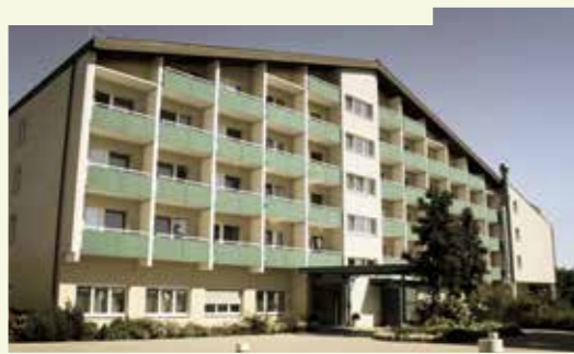
Inbetriebnahme Haus Bergfeld