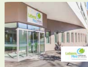
Lebens.Med Zentrum St. Pölten

Beste Gesundheit ist eine Partnerschaft von führenden niederösterreichischen Gesundheitsbetrieben, die eng miteinander verbunden sind. Jeder Betrieb setzt spezifische Schwerpunkte, wobei die natürlichen Heilvorkommen mit individuellen Therapien und kompetenter medizinischer Betreuung kombiniert werden. Im Mittelpunkt der Behandlung steht der Mensch mit seinen individuellen Zielen und Bedürfnissen.