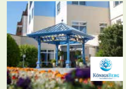
Gesundheitsresort Königsberg Bad Schönau