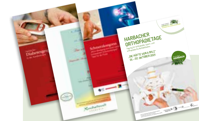
Veranstaltungsfolder im Laufe der Zeit

Seit mehr als 40 Jahren betreut das Moorheilbad Harbach Patienten mit Erkrankungen des Stütz- und Bewegungsapparates. Die Erfahrungen und das umfangreiche Wissen werden seit vielen Jahren in Seminaren und Kongressen im medizinischen und therapeutischen Bereich an interessiertes Fachpersonal weitergegeben.