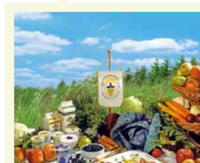
GRÜNDUNG ÖKOLOGISCHER KREISLAUF MOORBAD HARBACH