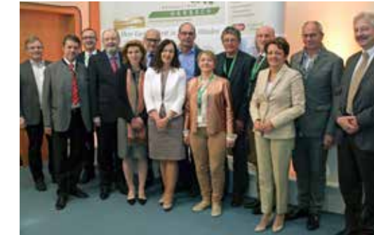
1. Schmerzkongress 2016