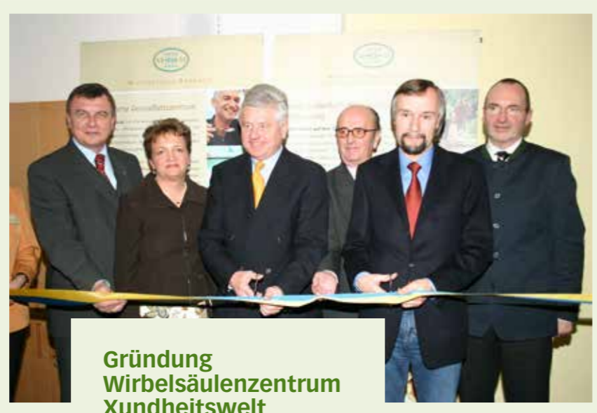
Gründung Wirbelsäulenzentrum Xundheitswelt