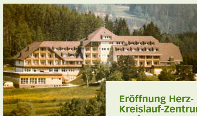
Eröffnung Herz-Kreislauf-Zentrum Groß Gerungs