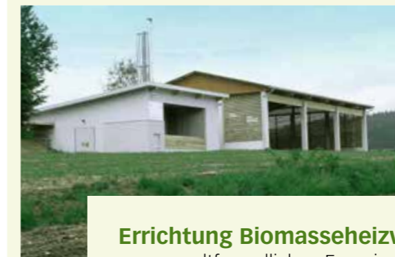
Errichtung Biomasseheizwerk zur umweltfreundlichen Energieversor- gung des Moorheilbades Harbach.