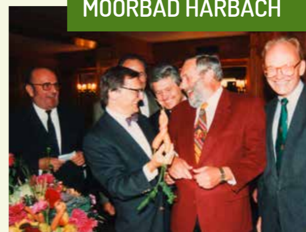
mit der NÖ Landesakademie. Ziel ist es, die Kulturlandschaft zu erhalten, Äcker und Wiesen organisch-biologisch zu bewirtschaften und die Erzeugnisse der Region gemeinsam mit dem ansässigen Gewerbe zu veredeln.