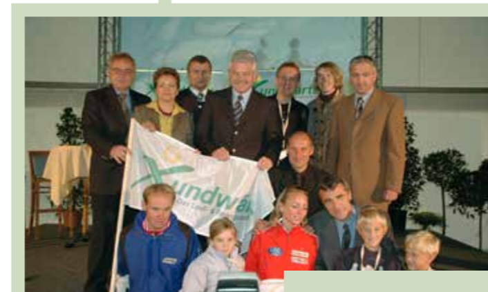
Eröffnung Lauf- und Bewegungs- zentrum Xundwärts

Als erster Gesundheitsbetrieb in Österreich wird das Moorheilbad Harbach mit dem Austria Gütezeichen für Gesundheitstourismus – Best Health Austria ausgezeichnet (ab 2008 wird die Bezeichnung „Premium“ verwendet).